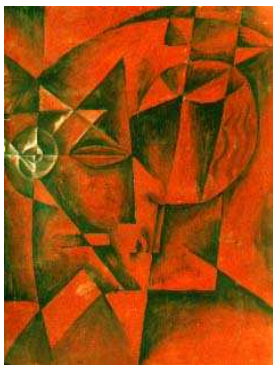
Kubistportrét svatého Pavla z Tarsu

Být prohlášen za svatého znamená být zbaven svéprávnosti. O mnoha svatých víme, kdy a kde se narodili, víme, kdy a kde zemřeli, můžeme si přečíst jejich literární pozůstalost, ale také s naprostou jistotou víme, že nikdy nežili.