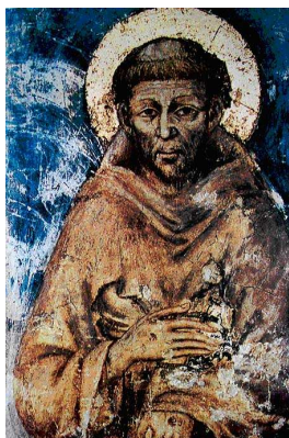
Svatý František dle Cimabua

Svatý František z Assisi - prostřáček a chudáček, tak ho tituluje církev svatá. Chudáček a prostřáček, dobrá duše, miluje vše mimo včely a mravence, neboť ti „snášeji“. František chtěl být nejen chudým materiálními statky, chtěl být chudým i duchem. Podařilo se mu to?